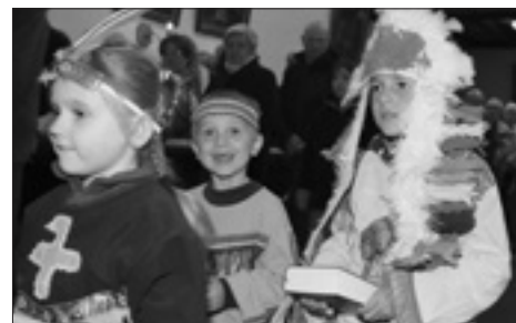
Obětní průvod dětí v Proseči u Skutče

K celosvětovým oslavám Misijní neděle se samozřejmě přidala i Česká republika. Misijní neděle leckde začala již v sobotu 17. října ve 21:00 vytvořením společného Misijního mostu modlitby , kdy se na úmysl misí zapalovaly svíce, modlil se růženec, konala se procesí či adorace. Nedělní bohoslužba spojená se sbírkou na papežské misie byla často obohacena misijní výzdobou a slavnostním přinášením obětních darů, které připomněly všechny kontinenty. Po mši svaté probíhaly tradiční akce PMD: Misijní jarmark ®, Misijní koláč ® a Misijní štrúdlování ®. Do národní kanceláře Papežských misijních děl přišlo mnoho zpráv o tom, jak se slavila Misijní neděle v nejrůznějších farnostech. Pro přiblížení atmosféry uvádíme některé ohlasy: