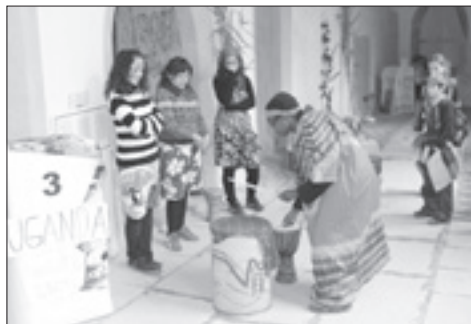
Z celostátního misijního kongresu dětí v r. 2010

Generální shromáždění PMD – termín: 30. 5. – 4. 6. 2016, místo: Řím Pracovní jednání Národních ředitelů PMD z celého světa, hodnocení činnosti a schvalování projektů na pomoc chudým ve světě, audience u Svatého otce.