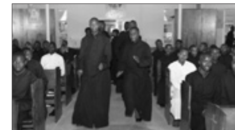
Bohoslovci v kapli (z misijní cesty do Keni 2014)