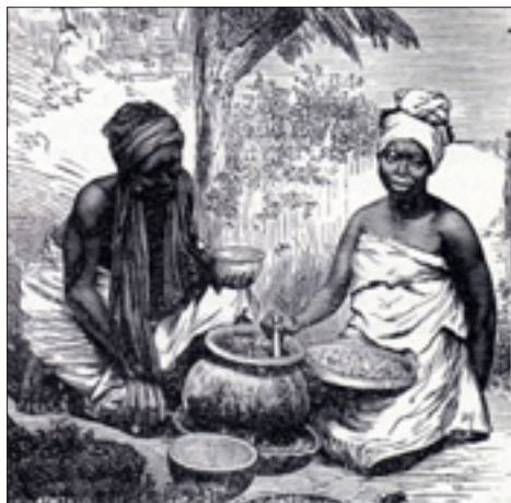
Prodavačky arašídů, ©2015 Papežská misijní díla

ní opakuje. Dítě křičí, jako když je na nože bere. Matka však toho nedbá, neboť je přesvědčena, že takto se rozdělí potrava, kterou dítě přijalo, stejnoměrně do všech čtyř údů jeho malého tělíčka.