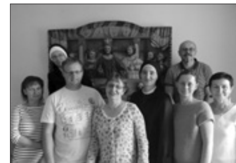
Diecézní ředitelé na setkání Národní rady