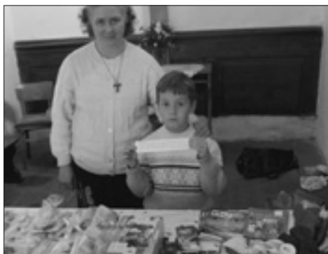
Misijní štrúdlování® v Pusté Polomi ©2015 Papežská misijní díla

zabalené balíčky v průvodu před oltář. Na konci bylo jídlo požehnáno a děti se ujaly prodeje před kostelem. Sešlo se, na naši malou farnost, nečekaných 126 balíčků dobrot a děti, i díky svému rozdávacímu nadšení, vybraly přes 8000 Kč. Byla to moc milá a požehnaná akce. Za rodinky z farnosti Martina, Věrka, Petra, Barča, Pustá Polom