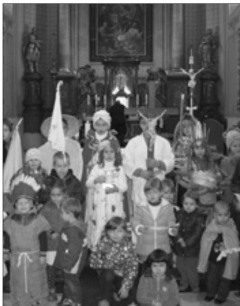
Vyškovské „děti z celého světa“