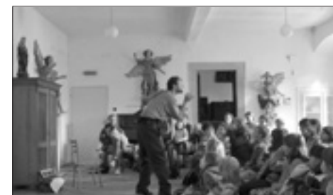
Představení „František blázen“ v roudnickém klášteře

3. října se ve farnosti Hodonín uskutečnilo II. Moravské klubkování. Na programu byla mše svatá, krátké představení Misijních klubek a následovalo zábavné putování po kontinentech, které bylo zakončeno adorací. Součástí programu byl Misijní jarmark® a misijní výstava. A dojmy jedné z účastnic: „Všechno mně to teprve dochází se zpožděním: to nadšení, to, že bych si moc přála, aby se misijní dílo šířilo dál, to, že Pán poslal děti vlastně ze tří vznikajících klubek, to, že má smysl něco takto dělat, i když je nutno vždy překonat mnoho překážek, i to, že se za ně budu ještě raději modlit, protože jsem je poznala.... To vše ve mně rozeznává tisícere zvonečky k oslavě Našeho Pána.“