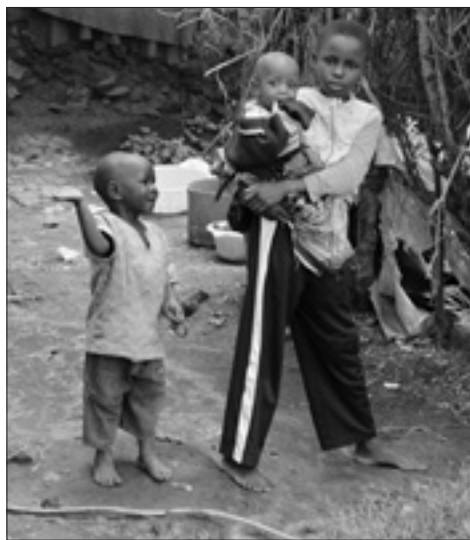
Z misijní cesty do Keni 2014

Pomoc zajišťují: Papežská misijní díla, 543 51 Špindlerův Mlýn 33, pmd@missio.cz , tel.: 499 433 058, 604 838 882, číslo účtu: 72540444/2700 www.missio.cz , Ti, kdo věnují finanční pomoc, se mohou zaregistrovat jako „dárci misii“. Zájemcům vystavíme potvrzení pro daňové účely.