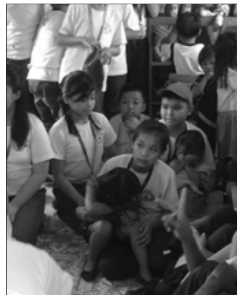
Děti ve středisku sester Kanosiánek

S velkou vděčností bych chtěla potvrdit přijetí finanční podpory, kterou jste nám poslali