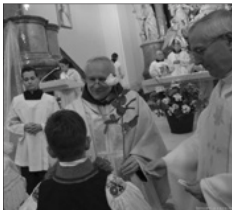
Misijní neděle v Hluku