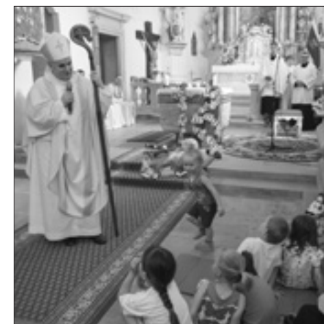
Z Misijní pouti do Vranova nad Dyjí v r. 2015

Národní rada PMD - Termín: 18 - 20. 4. 2016, místo: Špindlerův Mlýn Pravidelné pracovní jednání diecézních ředitelů PMD na horském středisku Eljon.