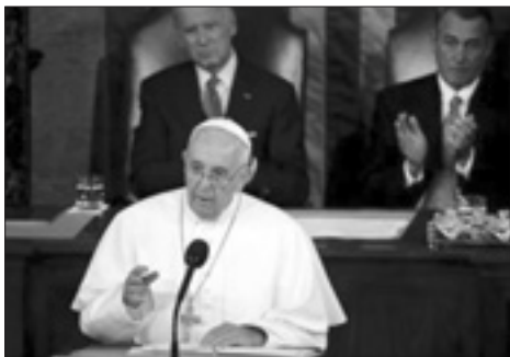
© 2015 převzato spolu s článkem z Radia Vatikán