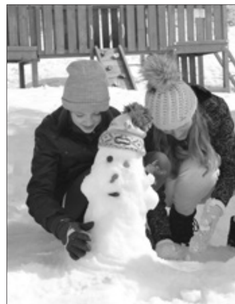
Horské klubání na jaře 2015

Ve dnech 14. - 18. 3. 2016 bude v městské knihovně Náchod k vidění putovní misijní výstava, včetně výrobků studentů a materiálů PMD. Výtěžek podpoří projekty papežských misí na Srí Lance. V Iráku pomůže prostřednictvím Diakonie ČCE.