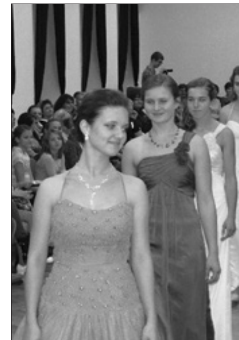
Buchlovická děvčata a sál plný diváků