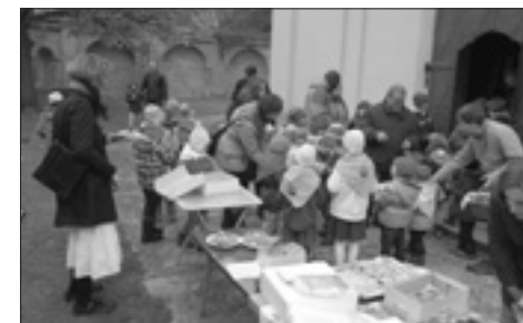
Misijní koláč® před kostelem v Lysé nad Labem

V Lysé nad Labem se mnoho rodin zapojilo do akce Misijní koláč®, který jsme pak po mši svaté u východu z kostela dávali lidem. Byla to úžasná atmosféra. Děti šířily naprosto nakažlivě svou radost. Když jsme začali počítat peníze, dcera poznamenala „to zachráníme hodně životů“. Vybralo se překvapivých 7003 korun. Přispěly i některé děti ze svého skromného kapesného a mají tak velký obdiv! Děti poznamenaly, že za rok zase vybereme.