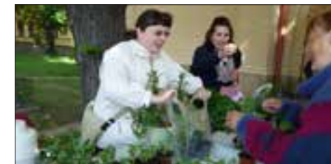
První květinový jarmark v Nebušicích.

Misijní klubka Letohrad a Slatina nad Zdobnicí uspořádala tradiční Misijní karneval pro děti a dospělé. Děvčata v klaunských oblecích organizovala pro všechny děti soutěže, hry a tanečky, do kterých se s chutí zapojili i rodiče. O dobroty se postaraly šikovné maminky, nikdo nepřišel na karneval s prázdnou a také s prázdnou neodešel. Všechna „čísla“ bohaté tomboly byla totiž výherní. A naše radost se znásobila tím, že jsme mohli odeslat na účet PMDD výtěžek z této akce 3.500 Kč.