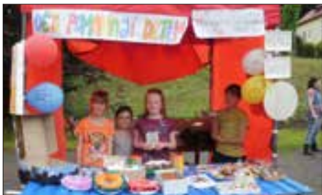
Malí misionáři na Kácení máje.

bylinky, trvalky, divizny, kopretiny, netřesky, cukety, slunečnice nebo třeba okrasné keře. Všichni též přivítali malé občerstvení v podobě muffinů ozdobených živými květy. Nakonec skoro všechny rostlinky našly svého nového majitele a na pomoc dětem v misiích se vybralo 2 940 Kč. Díky Bohu i všem dárcům.