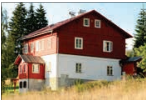
Horské středisko Eljon, Špindlerův Mlýn