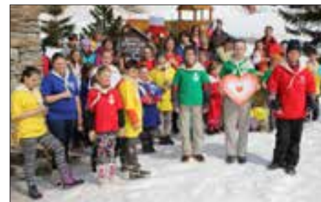
Účastníci Horského klubání.

Naši drazí a šikovní misionáři, máme radost, že je vás stále více. Do května 2015 bylo zaregistrováno už 236 Misijních klubek, v nichž je přihlášeno 3 150 dětí. Je to moc důležité, že svými modlitbami a aktivitami podporujete chudé děti v misiích.