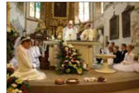
První sv. přijímání v Pardubicích.

„Ve farnosti Pardubice jsme 17. 5. 2015 slavili slavnost prvního svatého přijímání. Při poslední přípravné katechezi o Eucharistii paní katechetka nechala kolovat mezi dětmi arabský chléb, ze kterého si každý mohl kousek ulomit. Na závěr katecheze povzbudila děti, že tak jako Ježíš se s námi rozdělil i my se máme vzájemně dělit a pomáhat, kde je nouze. Nakonec paní katechetka nabídla dětem, že pokud chtějí, mohou ze svého něco ušetřit pro chudé děti. V neděli při prvním svatém přijímání přinesly děti do kasičky 1394 Kč, které jsme poslali na účet PMD.“