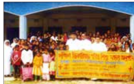
Bangladéš - den PMDD v jižní Vicarii.