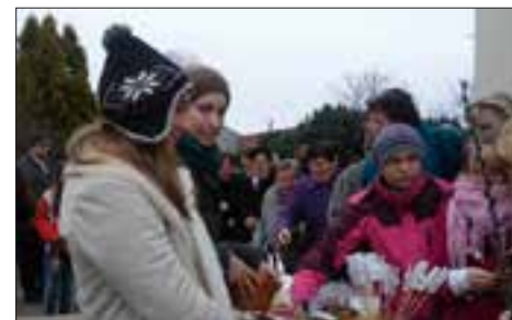
Velikonoční jarmark pro misie ve Starém Poddvorově.

„Na Květnou neděli 29. 3. jsme uspořádali v naší obci Starý Poddvorov, která patří do farnosti Čejkovice u Hodonína, první Velikonoční jarmark pro misie. Děkujeme za zaslání pohlednic pro malování dětmi, které jsme od Vás obdrželi. Akce byla požehnána, neobešlo se to samozřejmě bez překážek, ale s tím se pro Boží dílo přece počítá. Důležité je, že jsme pro misie získali částku celkem 10 000 Kč, což je na první pokus velmi krás-