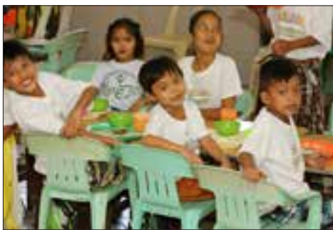
Oběd ve Zdravotním a sociálním centru sester kanosiánek.