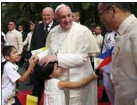
© 2015 převzato spolu s článkem z Radia Vatikán