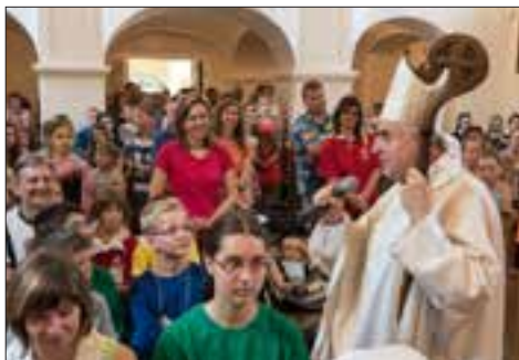
Mons. Vojtěch Cikrle s účastníky Celostátní misijní pouti.

Termín: 13. 6. 2015, místo: Vranov nad Dyjí Druhou červnovou sobotu se ve Vranově nad Dyjí konala 13. celostátní Misijní pouť a 10. Misijní den dětí. Na programu byla slavnostní mše svatá celebrotaná otcem biskupem Vojtěchem Cikrlem, násle-